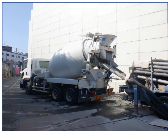
流動化処理土打設