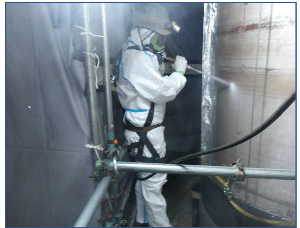
煙突内筒除染工事