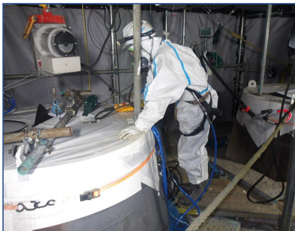
煙突内筒除染工事