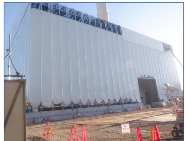
敷地内定点撮影(北東側)