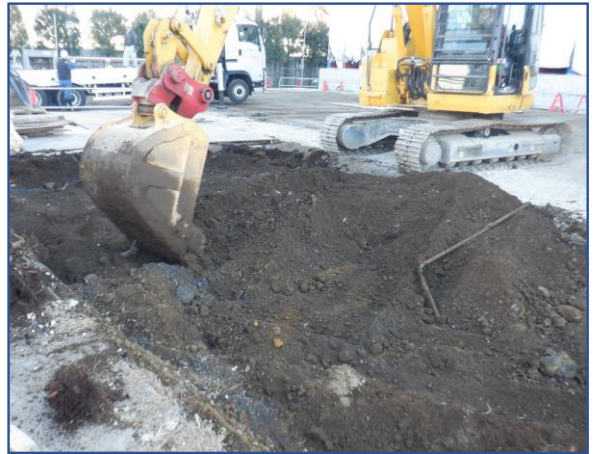
付属棟跡地土間基礎解体