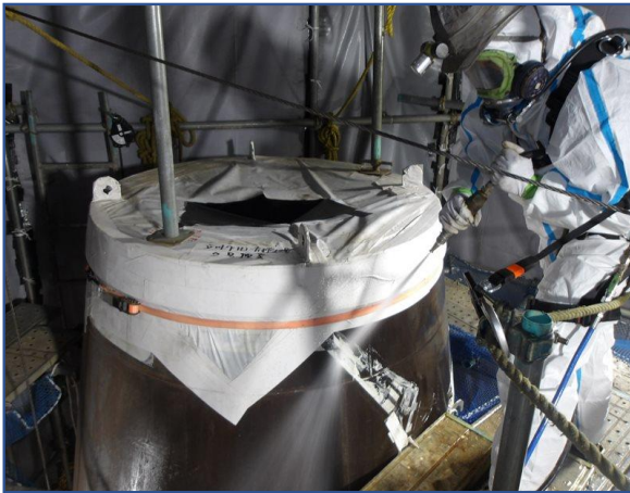
煙突内筒除染工事