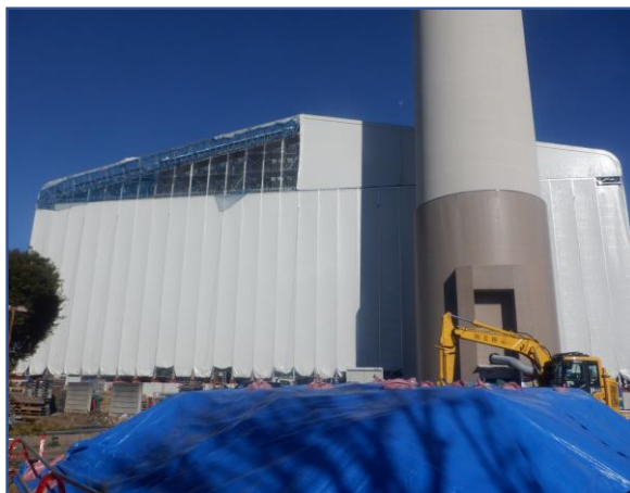
敷地内定点撮影(南西側)