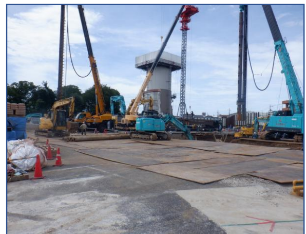
敷地内定点撮影(北東側)