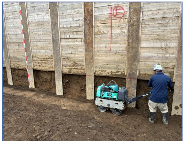
土壌汚染対策工事(埋戻し)