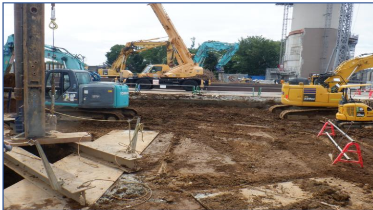
工場棟上屋解体後定点撮影(北西側)