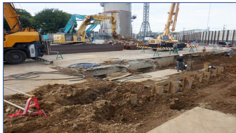
工場棟上屋解体後定点撮影(北東側)