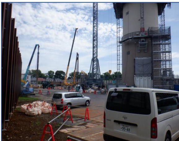
敷地内定点撮影(南西側)